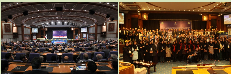
همایش بین‌المللی آبیاری و زهکشی ICID در سال ۱۳۹۰ با حدود ۱۲۰۰ میهمان خارجی و داخلی با میزبانی کمیته ملی آبیاری و زهکشی ایران، تهران

با میزبانی کمیته ملی آبیاری و زهکشی ایران بیست و یکمین کنگره بین‌المللی آبیاری و زهکشی، هشتمین کنگره بین‌المللی آبیاری میکرو و شصت و دومین نشست سالانه کمیسیون بین‌المللی آبیاری و زهکشی همزمان با چند نشست بین‌المللی دیگر در آبان‌ماه ۱۳۹۰ در تهران برگزار گردید. برگزاری این رویدادها بطور همزمان یکی از رخدادهای کم سابقه در سطح ملی و بین‌المللی در زمینه آبیاری و زهکشی می‌باشد. در طی ۸ روز برگزاری این رویداد، بیش از ۳۰۰ مقاله بصورت شفاهی و یا پوستر ارائه شد.